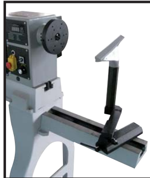
Rallonge et support d'outil extérieur Extension bed