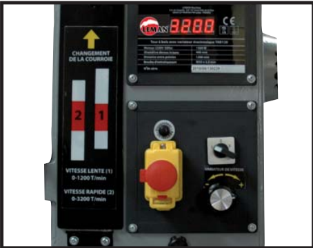
Variateur électronique Variable speed