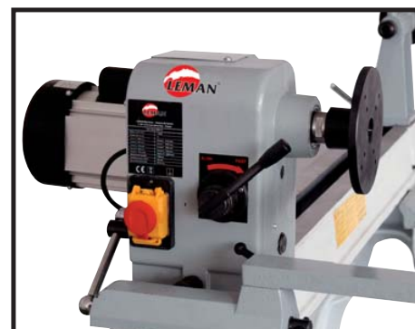
Rotation de la tête jusqu'à 180° Headstock pivots 180°