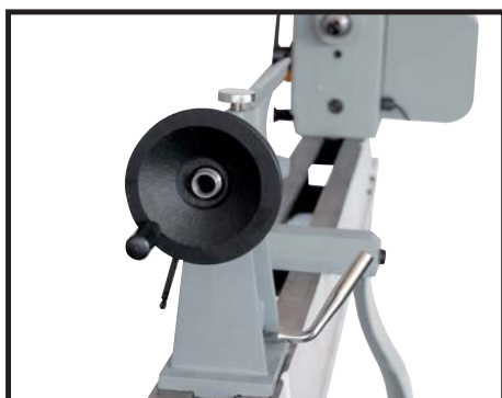
Poupée fixe et mobile percée à 9,5 mm Headstock and sliding headstock drilled at 9,5 mm