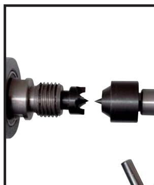
Broche d'entraînement CM2 filetée M33 x 3,5 CM2 headstock and threaded spindle drive M33x3,5