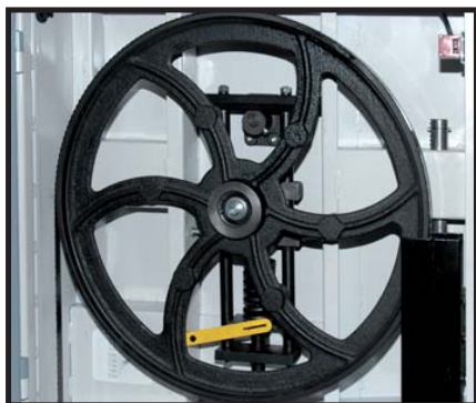
Volants en fonte d'acier équilibrés Cast iron wheels