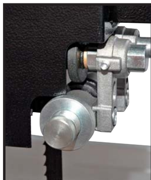
Guide de lame à galets Roller bearing blade guide