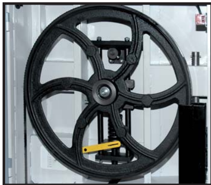
Volants en fonte d'acier équilibrés Cast iron wheels