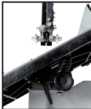
Table inclinable à 45° Bevel cuts up to 45°