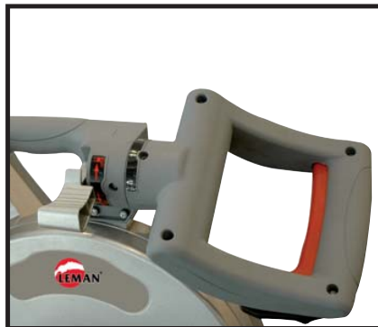
Poignée de coupe orientable Orientable Turnable handle