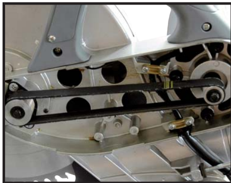
Transmission par courroie Belt transmission