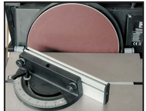
Guide d'onglet Miter gauge