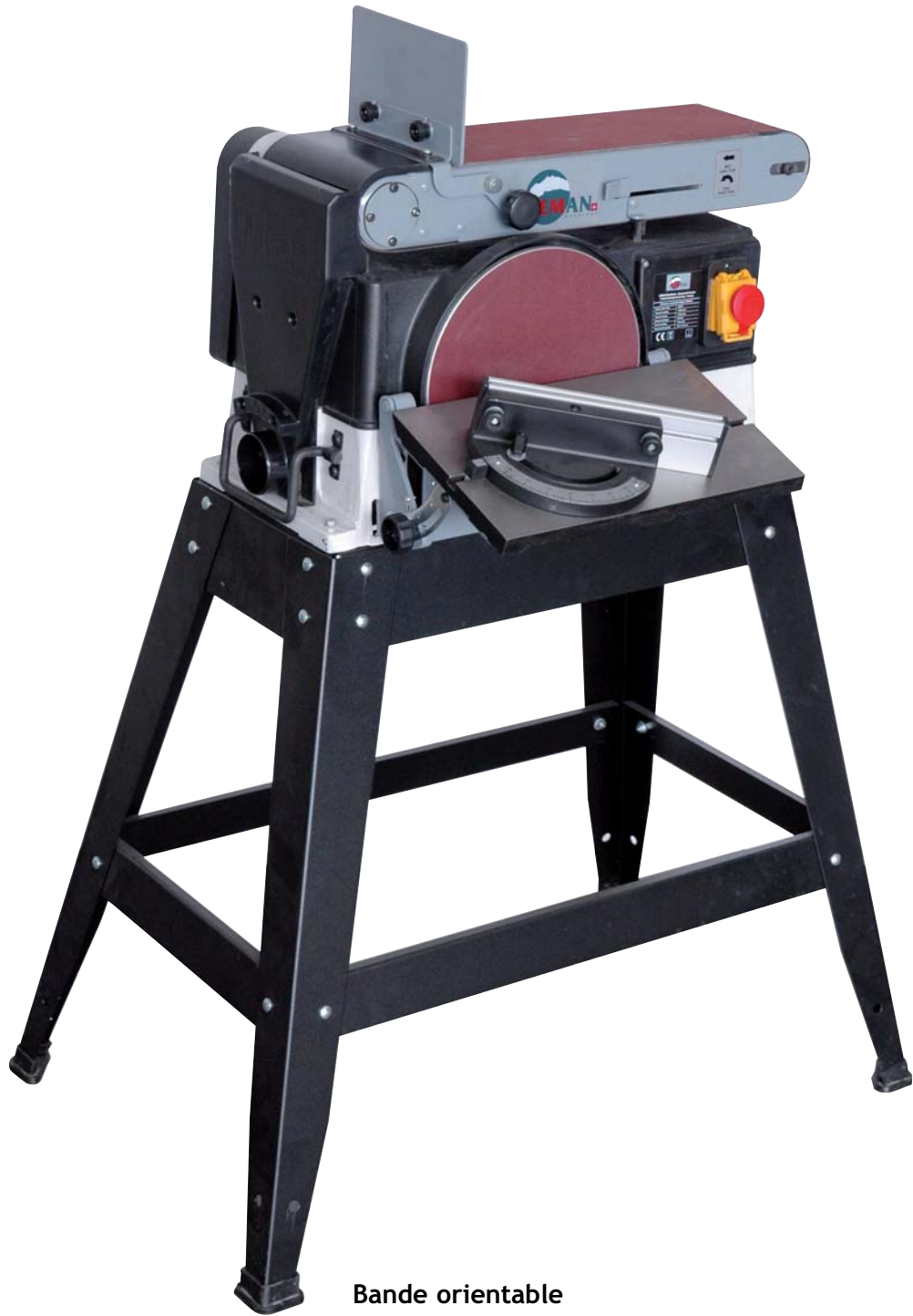
Table inclinable à 45°