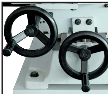
Double chariotage latéral et longitudinal sur queue d'aronde Horizontal and lateral movement on dovetail