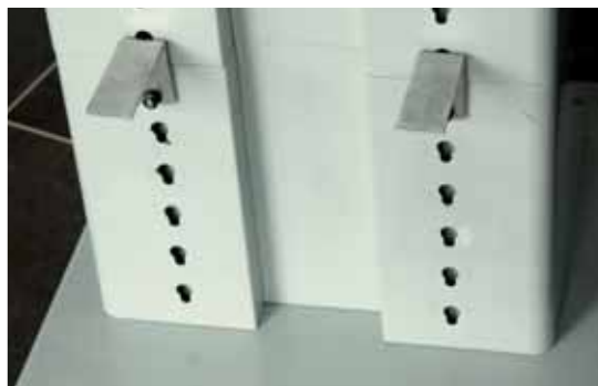
Leviers de chariotage latéral et longitudinal