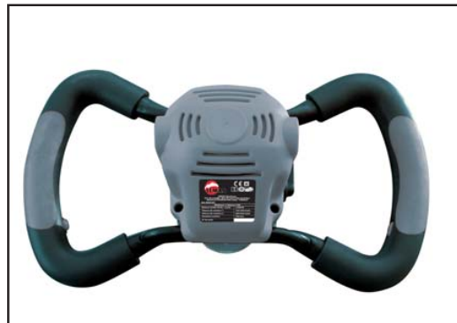
Poignées parallèlement disposées Parallel handles