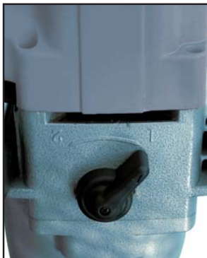
2 modes de vitesse Lent / rapide 2 speeds Slow / fast