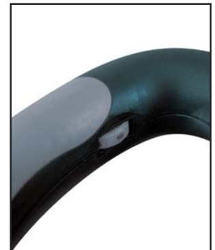
Régulateur de vitesse électronique Electronic speed regulator